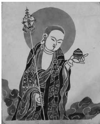
図6 「試作染め 地藏菩薩」 芹沢恵子氏所蔵