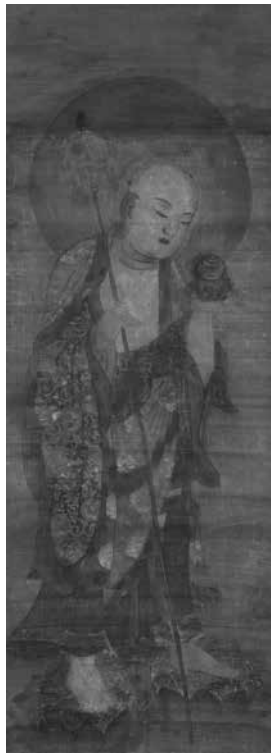
図2 「地蔵菩薩図」室町時代 静岡市立芹沢銈介美術館所蔵

なお、芹沢の描く「地蔵菩薩」は足元を描いていないが、本図では踏み割り蓮華の上に立ち、半歩を踏み出している。こうした動勢は、来迎の場面によく見られるもので、地蔵来迎図の一例といえよう。浄土教の基礎を築いた恵心僧都源信は、寛和9年（985）に撰述した『往生要集』の中で、地獄の救済者としての地蔵菩薩について説いている。末法とは、仏の教えのみが存在し、悟りに至るものがない時期のことで、末法の世の到来に怯える人々にとって、地獄への恐怖は切実なものであった。来迎とは、臨終間際の往生者を極楽浄土に迎えるため、仏が往生者の目の前に現われることをいい、極楽世界の教主である阿弥陀如来が一般的だが、地獄からの救済者である地蔵菩薩もまた、来迎図にしばしば登場する。